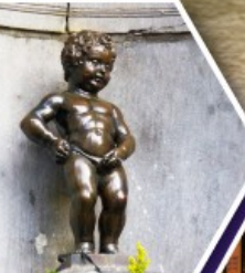
แมนเกินฟิส