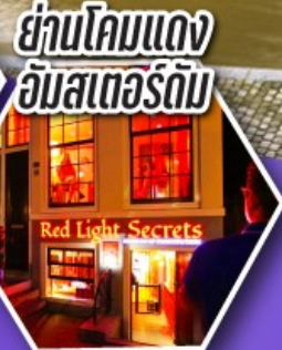
ย่านโคมแดง อัมสเตอร์ดัม

ตะลุยอัมสเตอร์ดัม ทั้งจตุรัสดามสแควร์ และย่านโคมแดง (Red Light) ราคาเริ่มต้น