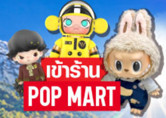
เข้าร้าน POP MART