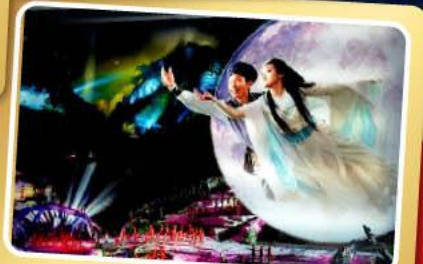
โชว์จิ้งจอกขาว