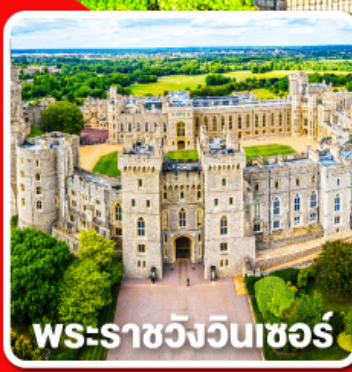
พระราชวังวินเซอร์

พักผ่อนนอน 4 คืนและ อิสระให้ท่านได้เที่ยวลอนดอนแบบเต็มอิ่ม 1 วัน