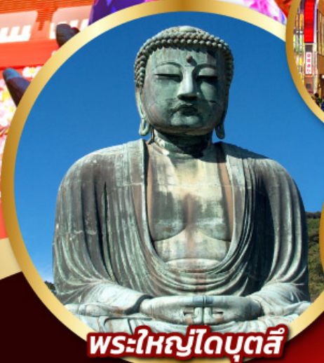
พระใหญ่โตบุตสึ