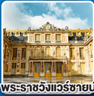
พระราชวังแวร์ซายน์