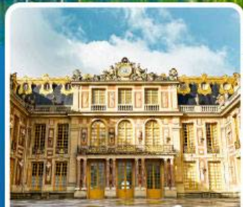
พระราชวังแวร์ซายน์