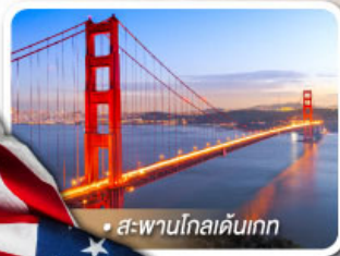
• สะพานโกลเดนเกต

★ เยือนอุทยานแกรนด์แคนยอน ผัง South rim ความมหัศจรรย์ทางธรรมชาติ ที่ยิ่งใหญ่ที่สุดแห่งหนึ่งของโลก