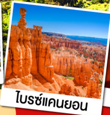
โบรซ์แคนยอน