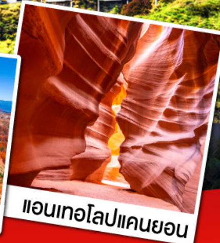
แอนเทโลปแคนยอน