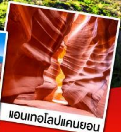
แอนทอปแคนยอน