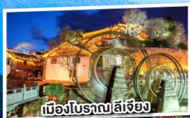
เมืองโบราณ ลี่เจียง