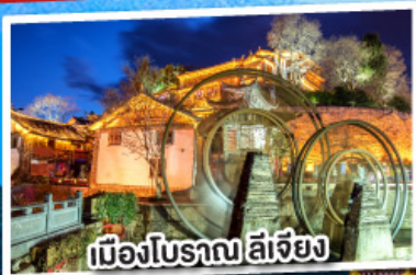
เมืองโบราณ ลี่เจียง