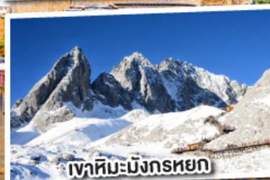
เขาสหิมะมังกรหยก