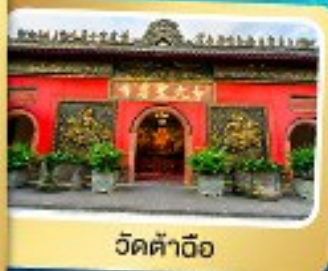
วัดต้าอ้อ