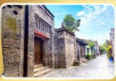
ถนนโบราณซอยกว้างซอยแคบ