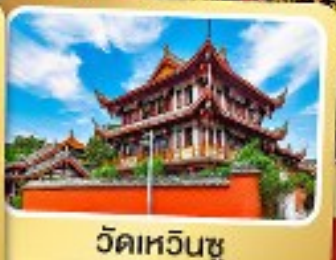
วัดเหวินชู่