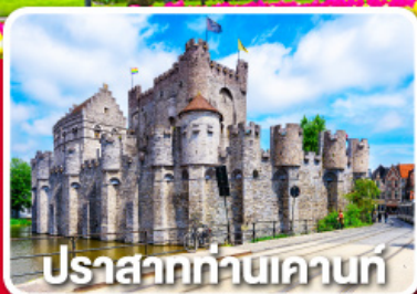
ปราสาทท่านเคานท์