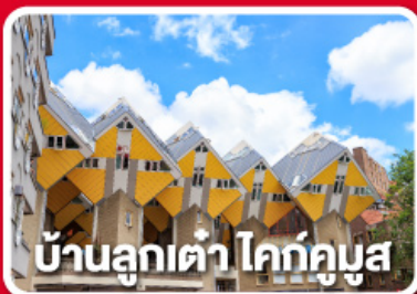
บ้านลูกเต่า ไคท์คูบัส