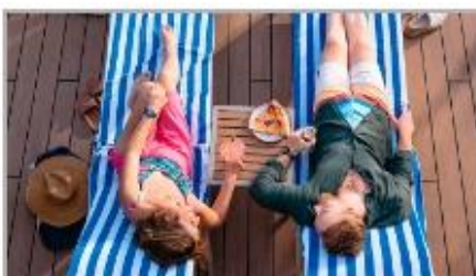
Whatever You Need, Delivered