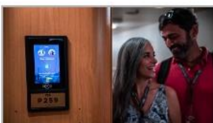
Keyless Stateroom Entry