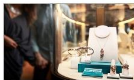
The Shops of Princess