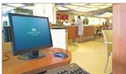
Internet Café & Library