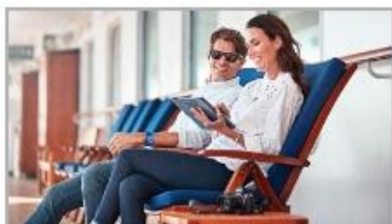
The Best Wi-Fi at Sea