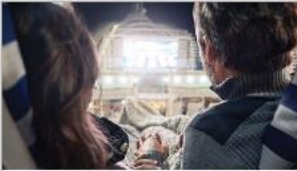
Movies Under the Stars®

Original musicals, dazzling magic shows, feature films, top comedians and nightclubs that get your feet movin' and groovin'. There's something happening around every corner; luckily, you have a whole cruise of days and nights to experience it all. 1