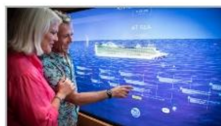
Events On Board