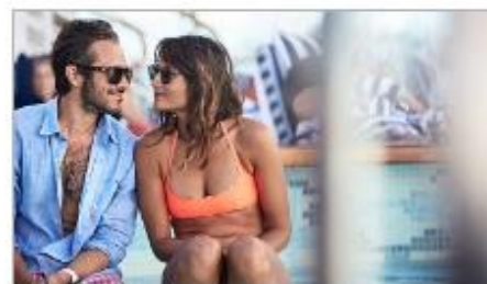
Freshwater Pools & Hot Tubs