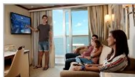
Simplified Safety Training