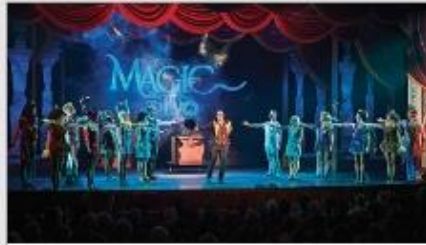
Original Musical Productions