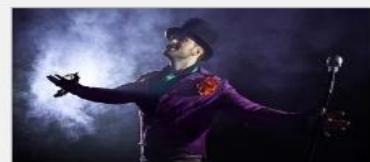
Featured Guest Entertainers