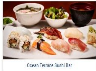
Ocean Terrace Sushi Bar