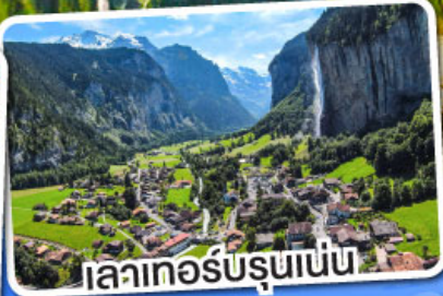
เลาเกอร์บรุนเนน

เดินทาง 12-18 มี.ค. 68 28 มี.ค.-03 เม.ย. 68 10-16 เม.ย. 68 29 เม.ย.-05 พ.ค. 68