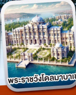
พระราชวังโดลมาบาเซ