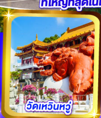
วัดเหวินหวู่