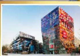
ช้อปปิ้ง SANLITUN