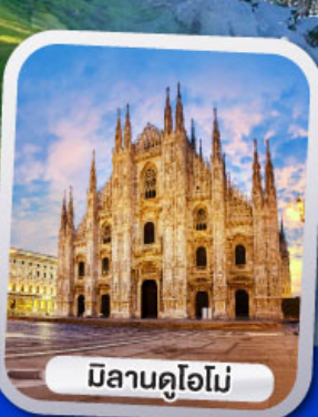
มิลานคูโอโม