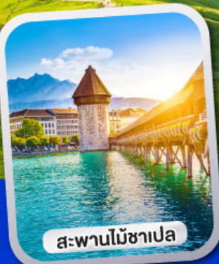
สะพานไม้ชาเปล