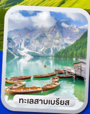
ทะเลสาบเบรียส