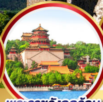
พระราชวังฤดูร้อน อิ๋หุ่ยฮวน