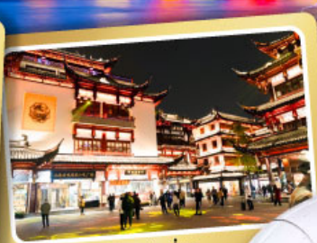
ตลาดร้อยปีเฉิงหวงเหมียว