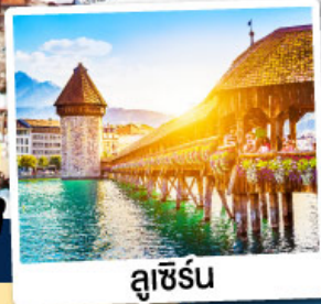
ลูซิิร์น

พิเศษ!! อาบนํ้าแร่แช่นํ้าอุ่น ณ เมืองลูคอร์เนค เมืองแห่งนํ้าแร่สวิตเซอร์แลนด์