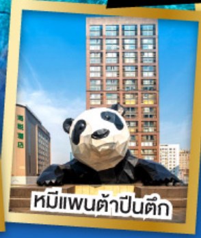
หมีแพนด้าปิ่นตึก