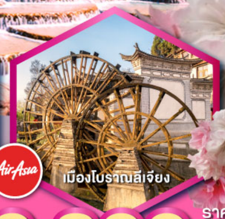
เมืองโบราณลีเจียง