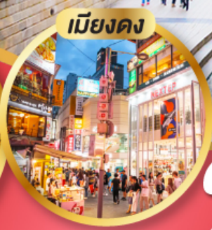
เมืองคัง