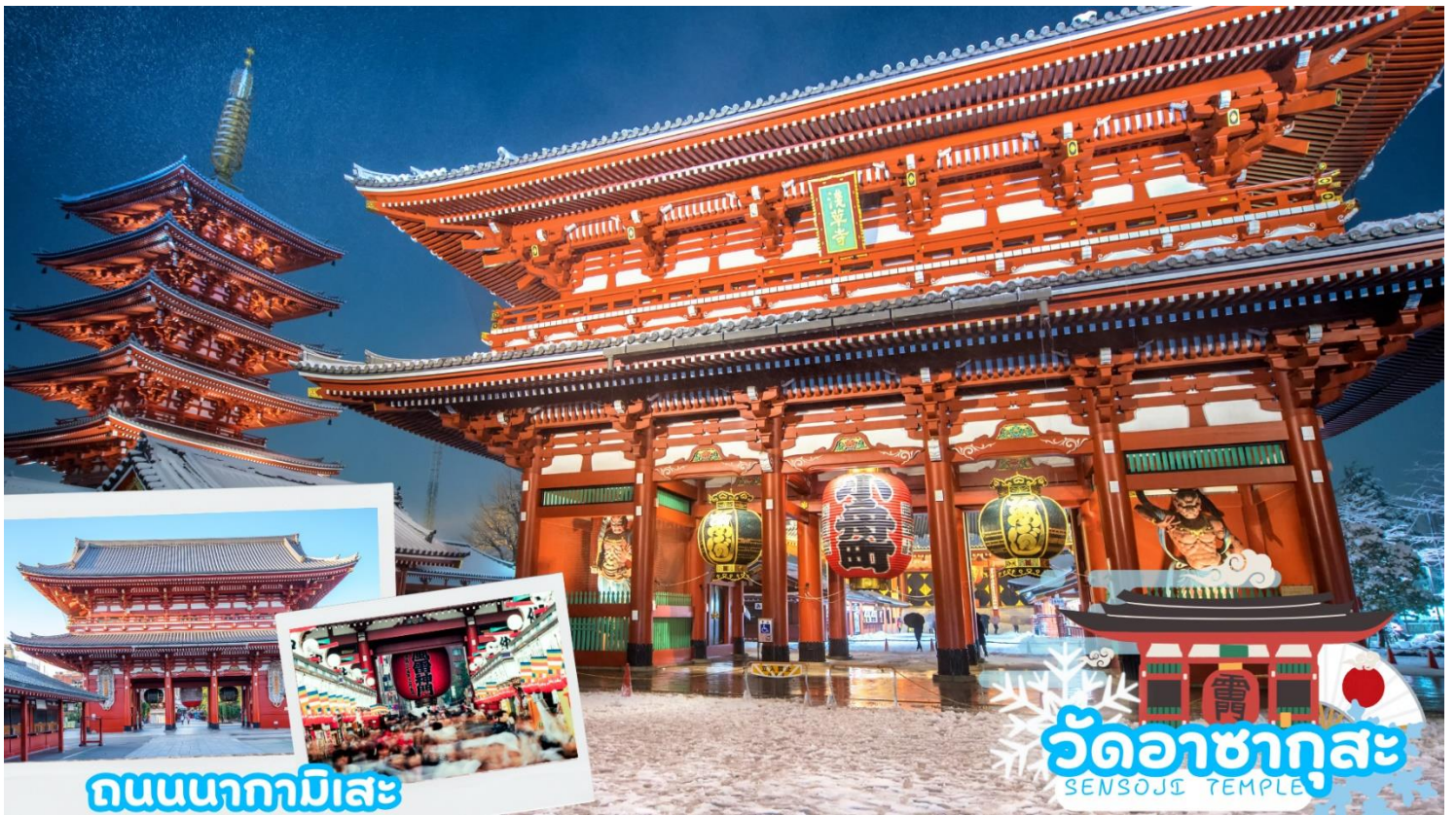
ถนนนากามิसे

กลางวัน รับประทานอาหารกลางวัน ณ ร้านอาหาร (มือที่ 1)