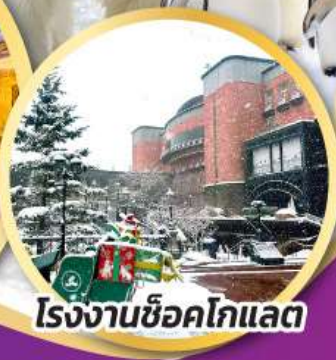
โรงงานช็อคโกแลต