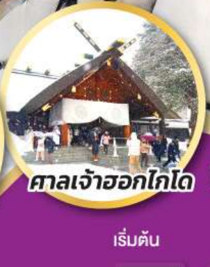
ศาลเจ้าออกโทโด