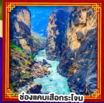
ช่องแคบเสือกะโจน