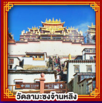
วัดลามะชงจันหลิง