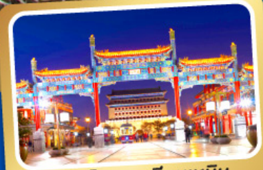
ถนนโบราณเทียนเหมิน