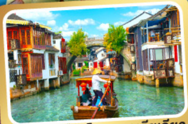
ล่องเรือเมืองโบราณจูเจียเจียว