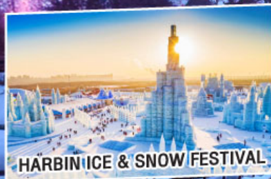
HARBIN ICE & SNOW FESTIVAL