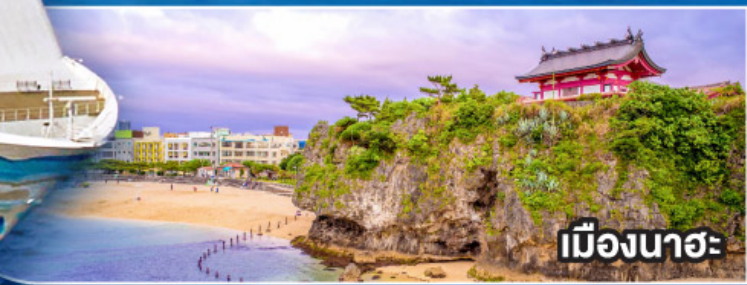
เมืองนาฮา