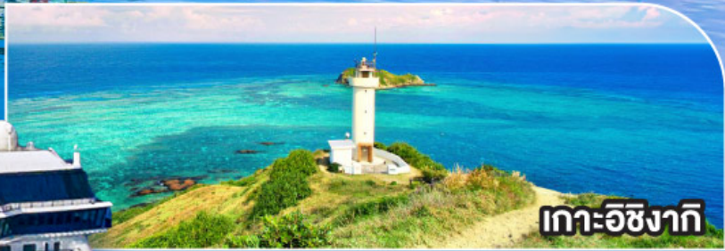
เกาะอิซางากิ