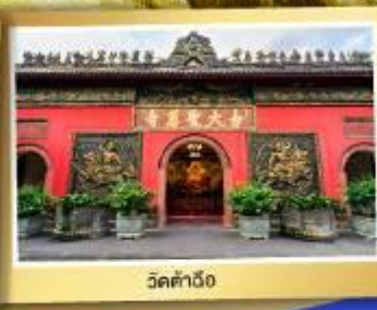
วัดต้าถิง