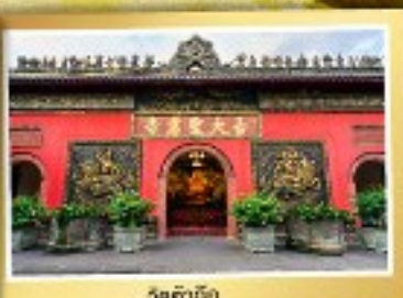
วัดต้าเจี๋ย