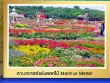
สวนสวรรค์แห่งดอกไม้ Manhua Manor