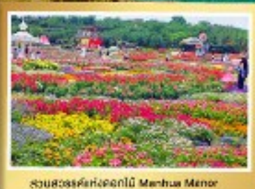
สวนสวรรค์ดอกไม้สีฤดู Mianhua Menor