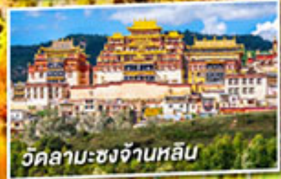
วัดลามะซงจ้านหลิน