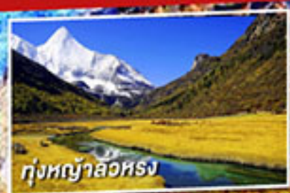
ทุ่งหญ้าลิวหรง