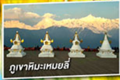
ภูเขาหิมะเหมยลี่