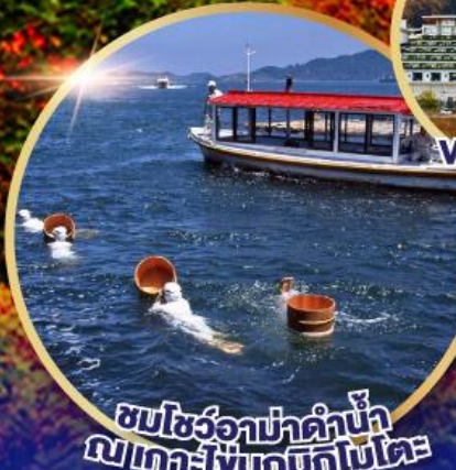
ชมโชว์อากาฮาคาน้ำ เฉพาะโอบุซึกิโกโมโตะ

25-30 ต.ค.67/15-20 พ.ย.67 29 พ.ย. - 04 ธ.ค. 67 13-18, 19-24 ธ.ค. 67