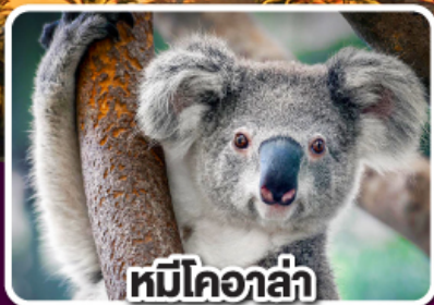
หมีโคอาล่า