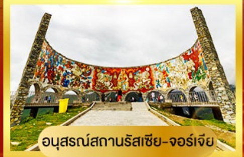
อนุสรณ์สถานรัสเซีย-จอร์เจีย

นั่งรถ 4WD ตะลุยสู่ใจกลางเทือกเขาคอเคซัส | เข้าชมวิหารศักดิ์สิทธิ์ ซามิบา เที่ยวเมืองถ้ำอันเก่าแก่ อัฟลิสต์ซิคห์ | พิเศษ มื้ออาหารไทย ณ กรุงทบิลีซี