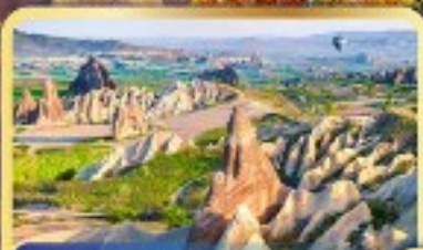
• หุบเขานกฟีนิกซ์