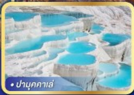
• ปามุกคาเล่