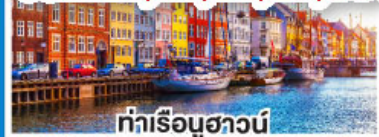
ท่าเรือฮาวน์

ล่องเรือสำราญสุดหรู DFDS พร้อมห้องพักแบบ Sea View