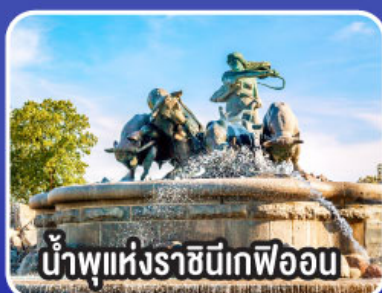
น้ำพุแห่งราชินีเกฟิออน