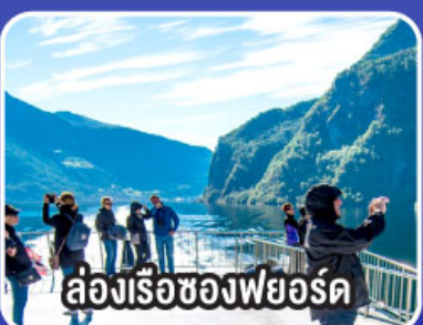
ล่องเรือช่องฟยอร์ด