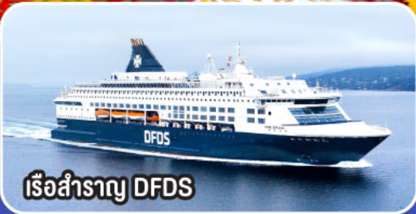
เรือสำราญ DFDS