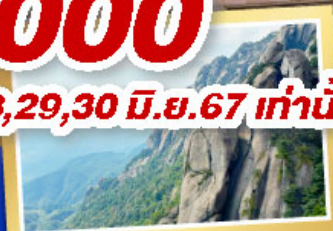
เทาลิ่งซาน