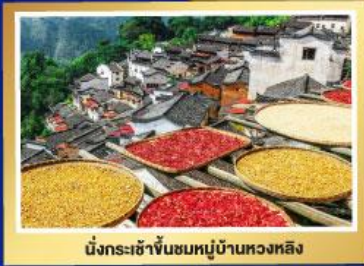
นั่งกระเช้าขึ้นชมหมู่บ้านหวงหลิง