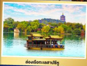
ล่องเรือชมวิวทะเลสาปซีหู