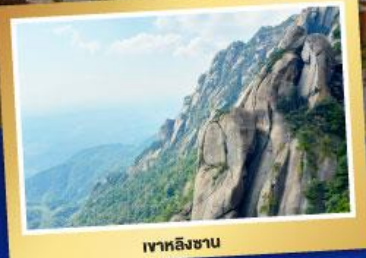
เขาหลิงซาน