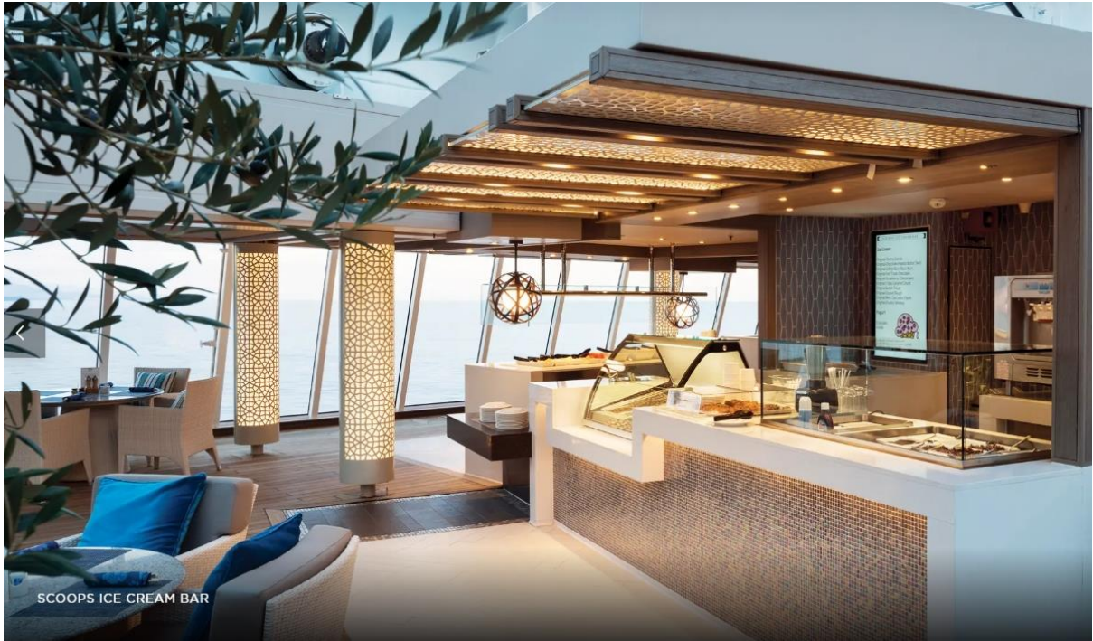
SCOOPS ICE CREAM BAR