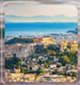
Piraeus (Athens) Greece

เที่ยวประเทศ GREECE – TURKEY 2 ประเทศ 8 เมือง