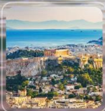
Piraeus (Athens) Greece

เที่ยวประเทศ GREECE – TURKEY 2 ประเทศ 8 เมือง