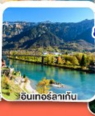
อินเทอร์ลาเก็น