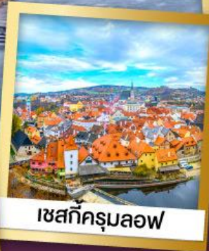
เซสกีครุมลอฟ