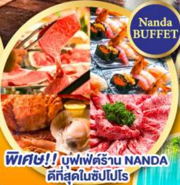
พิเศษ!! บัฟเฟต์ร้าน NANDA ดีที่สุดในซัปโปโร