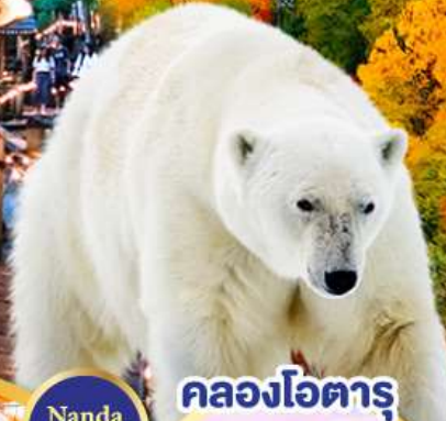
คลองโอดารุ