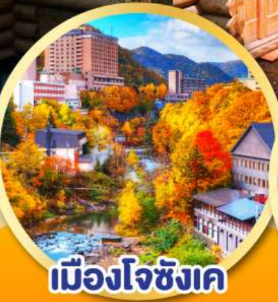
เมืองโจซังเค