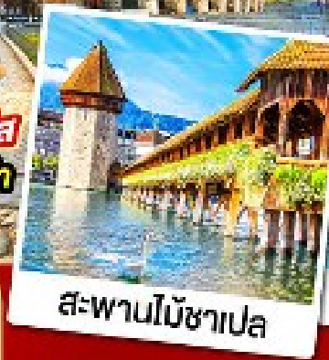
สะพานไม้อาเปลา