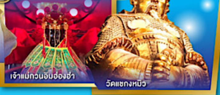
เจ้าแม่กวนอิมฮ่องซ่า