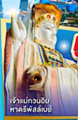
เจ้าแม่กวนอิม หาครีฟส์ลีย์