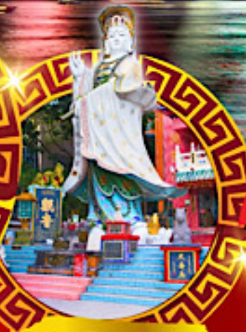
เจ้าแม่กวนอิม ทาดริฟส์ลีย์