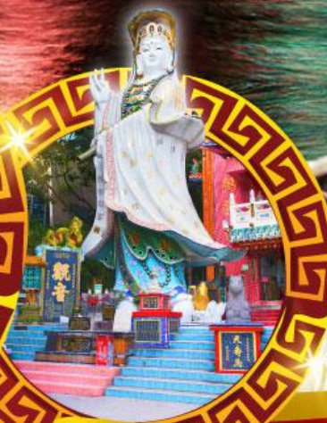
วัดเจ้าแม่กวนอิมฮ่องอ๋า