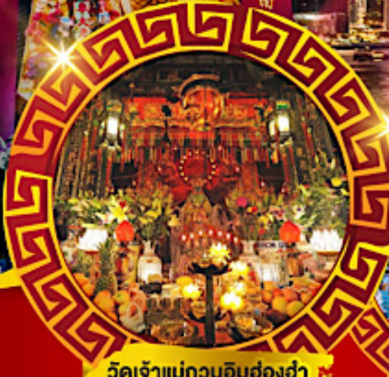
วัดเจ้าแม่กวนอิมซ่งฮ่า