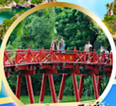
สะพานแสงอาทิตย์