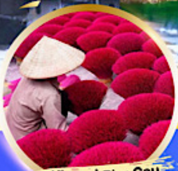
หมู่บ้านรูป Phu Cau