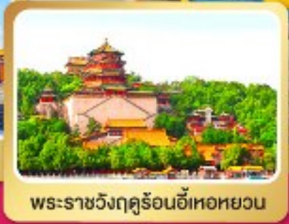
พระราชวังฤดูร้อนอีเหอหยวน