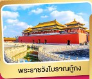
พระราชวังโบราณตู่กิง